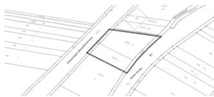
Katasterplan mit Änderungsbereich

Der Geltungsbereich der 5. Änderung des Flächennutzungsplans im Bereich Gartenbau ergibt sich aus folgendem Kartenausschnitt: