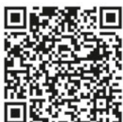
Meldeplattform Asiatische Hornisse

Sichtungen von Einzeltieren und insbesondere Nester sollen weiterhin ausschließlich über die Meldeplattform der Landesanstalt für Umwelt gemeldet werden. Dies kann über die Homepage der Landesanstalt für Umwelt (LUBW) oder über die kostenlose „Meine Umwelt-App“ erfolgen: