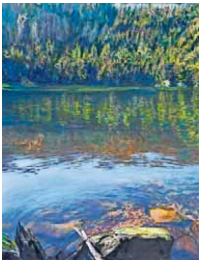
„Spiegelung – Feldsee I“